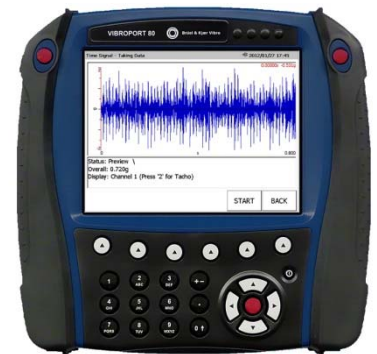
Screenshot eines Rohdatensignals