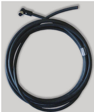
Abb. 1: AC-1311